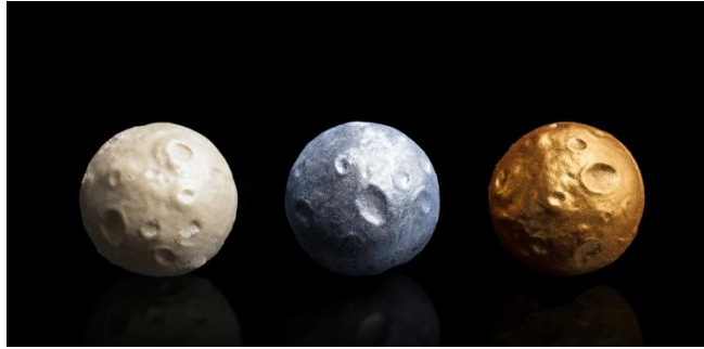
三款融合單一產地純朱古力及精心配搭茗茶的口味包括宇宙之迷、殞石味力及黑洞誘惑。