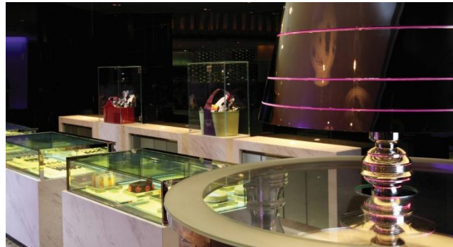
位於酒店大堂的時尚型格餅店 COCO呈獻各式瑰麗甜點