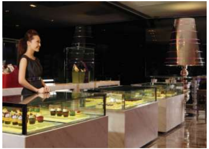
位於酒店大堂的型格餅店 COCO，呈獻各式瑰麗甜點。