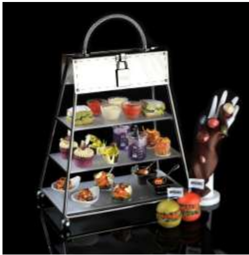
參照手袋造型的三層架上，展示了以型格時裝主題甜點，以及採用 The Mira 首次引入的 IMPOSSIBLE™ 植物漢堡 匠心巧製的鹹點素食。