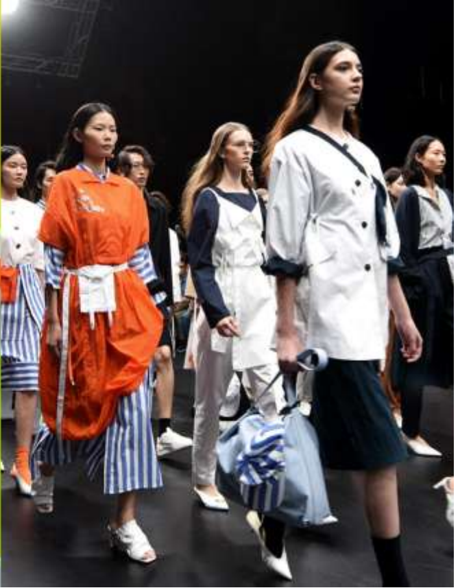
Coco 與由香港貿易發展局舉辦的 CENTRESTAGE 亞洲矚目時裝盛會攜手，推出以窺探未來為主題的下午茶糕點。