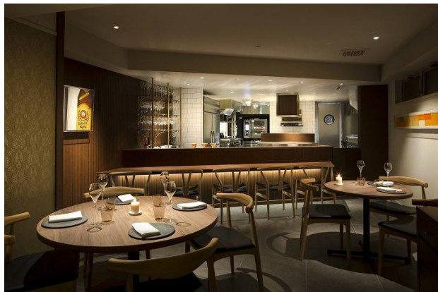
位於東京西麻布的 Crony 提供融入北歐風情的現代法國菜，氣氛雅致溫暖。